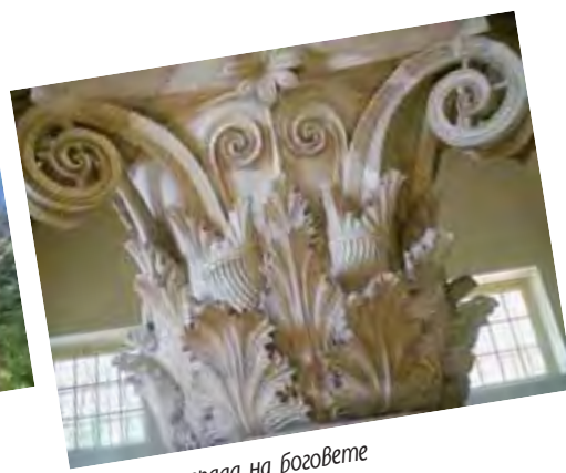
Колоната от града на боговете