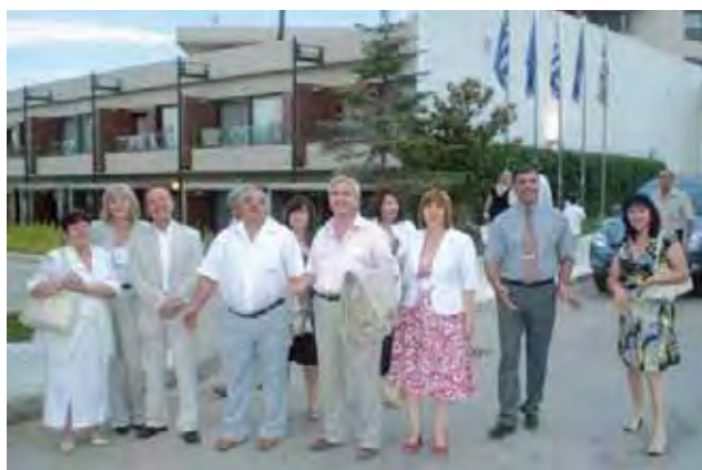
Група от Хасково

диви кози и красиви места, голяма част от които могат да бъдат видени само от кораб. Морето е много спокойно, изключително чисто и прозрачно.