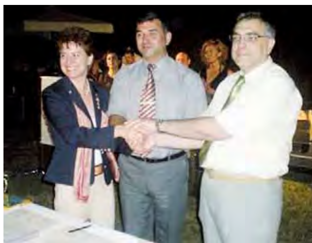
Подписване на Меморандума за сътрудничество по програми на Ротари